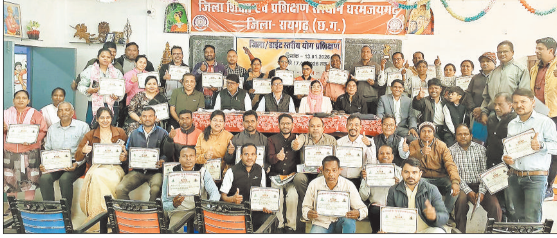
ट्रेनिंग के बाद प्रमाण पत्र के साथ शिक्षक।

कार्यक्रम का मुख्य उद्देश्य शिक्षकों एवं प्रशिक्षकों को योग के सैद्धांतिक एवं व्यावहारिक ज्ञान से सशक्त बनाना था, ताकि वे विद्यालय स्तर पर विद्यार्थियों को योग के महत्व से अवगत करा सकें। नई शिक्षा नीति 2020 के अंतर्गत योग को शिक्षा के पाठ्यक्रम का एक अभिन्न हिस्सा माना गया है। इसी क्रम में यह प्रशिक्षण आयोजित किया गया।